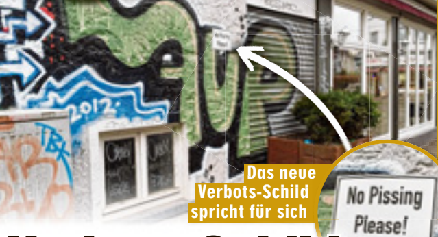
Das neue Verbotsschild spricht für sich