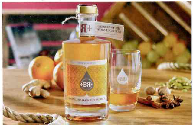
Orangenlikör Whiskey aus der Manufaktur Birgitta Rust Piekfeine Brände Orange liqueur whiskey from the Birgitta Rust Piekfeine Brände distillery